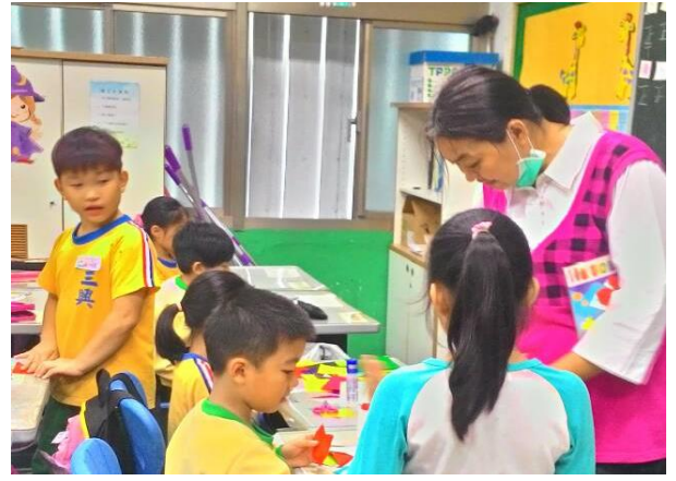
入班說故事時間：一本一本精彩故事帶動著能量傳承下去