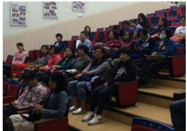
新版的 CPR 急救:口號【叫叫 CABD】，壓阿壓，二十秒三十次，頸部暢通吹兩口氣