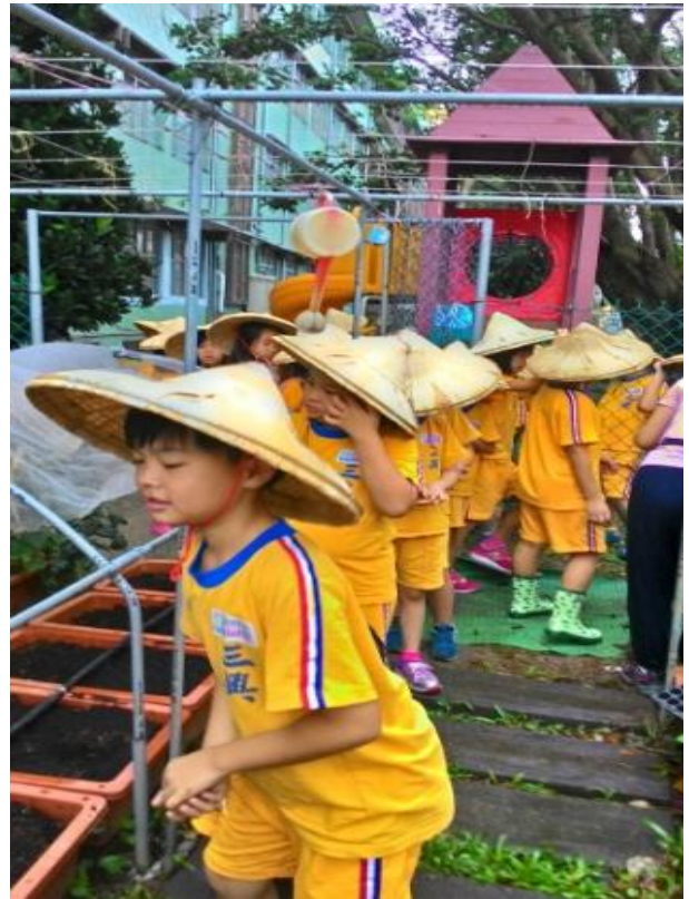
菜園園丁：從撥土、鬆土、灑種子、施肥、澆水、除草、樣樣自己動手作，期盼豐收