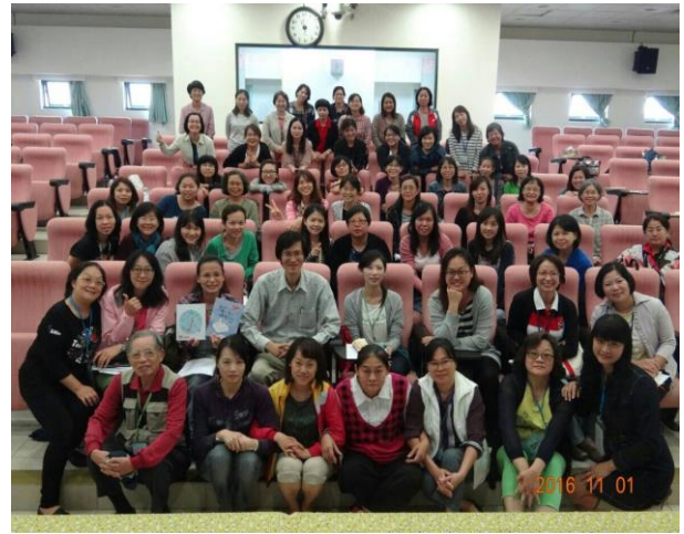
林仲璽基金會研習，每周二早上故事培訓，精進故事能力、充電能量好時機